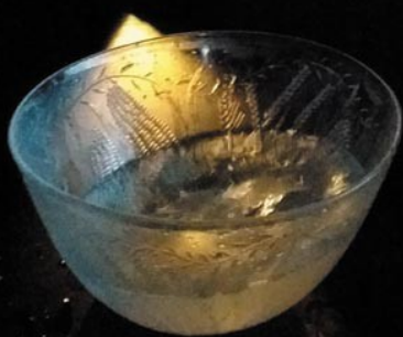
«GOUTTE» sortie de résidence à l'Entre-Pont, Nice 22 mai 2023